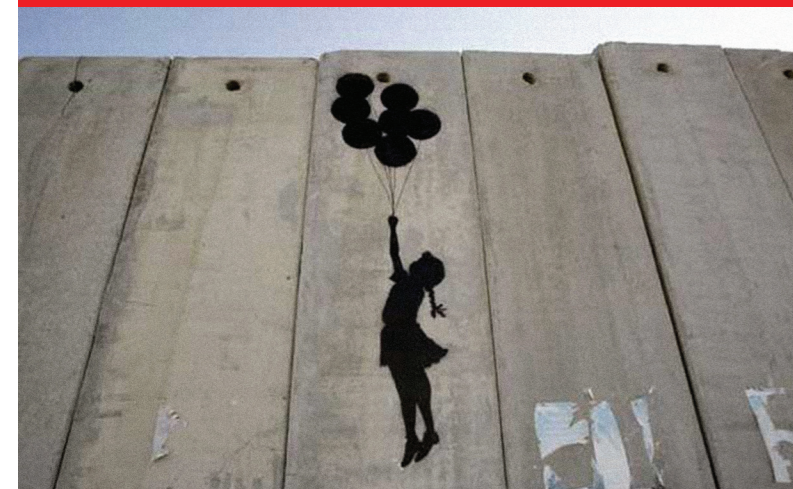
ציור של בנקסי, חומת ההפרדה, 2005.