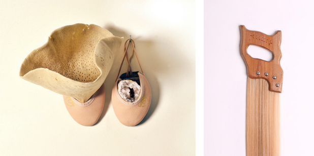
הילה עמרם ללא כותרת 2013, טכניקה מעורבת