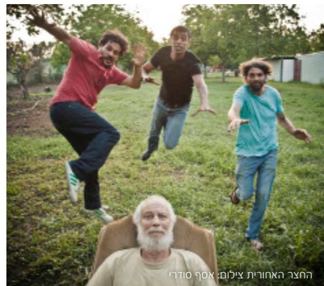
החצר האחורית

מידי יום שישי בחצר בית מיכל יתקיימו תרגול ולמידה של דרכים חדשות להניע את הגוף והנפש, חיזוק הקשר בין התנועה לנשימה, והרחבת גבולות הגוף ע"פ אמנות הצ'י קונג. מנחה: אסף טנא התרגול מתקיים בימי שישי בין השעות 09:00-10:30 המפגש בתשלום 40 ₪ עלות הסדנה: 320 ₪ לשמונה מפגשים