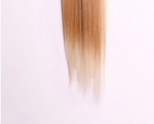
הילה עמרם ללא כותרת, 2010, טכניקה מעורבת

שעות פתיחת הגלריה: א', ג', ה' 16:00 - 19:00 ב', ד' 09:00-12:00 ד' 17:00-22:00 ולפי תאום מראש