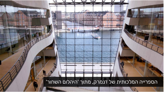
הספרייה המלכותית של דנמרק, מתוך 'היהלום השחור'

מחוץ למבנה הגרניט המרשים, הנוף קופא ומפשיר בדרמטיות האופיינית לארצות הצפון, ובפנים בלבה של קופנהאגן בספרייה המלכותית של דנמרק מתנהלת תנועה ערה של רעיונות. הסרט עוקב אחרי אוצרות הספרייה, אורחיה ואלה השוקדים על הכנת תערוכות בנושאים מטלטלים כמו עבדות ומשבר האקלים, מארחים אמנים כמו אולאפור אליאסון ומרינה אברמוביץ' - המציעים דרכים חדשות להתייחס בהן לספרים - ומקדישים ימים לשימור ומחקר של אוספים נדירים. המראות המתחלפים של טבע ועיר מתערבבים עם הלהט האינטלקטואלי וביחד הפוכים את האתר למוקד של סערה יצירתית. דנמרק 2019, 59 דקות, כתוביות בעברית ובאנגלית. בשיתוף עם דוק אביב