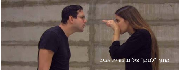
מתוך "לסמן"

בקרב קהילת השומעים ישנן שפות סימנים רבות ומגוונות ולכל אחת דקדוק ותחביר, מורכבות ועושר ייחודיים משלה. שלושה דורות של משתתפים, חירשים ושומעים, ולצידם חוקרות המעבדה לחקר שפת הסימנים באוניברסיטת חיפה, מספרים על שפות הסימנים שצמחו בישראל בתחילת המאה העשרים. בכך ממשיכה אביב את הדיון בסוגיות היקרות לליבה, אלה של שפת האם, של התרגום ושל ההעברה הבין-דורית. 60 דקות ישראל/ צרפת (2018)שפת הסימנים, עברית, אנגלית, תרגום לעברית