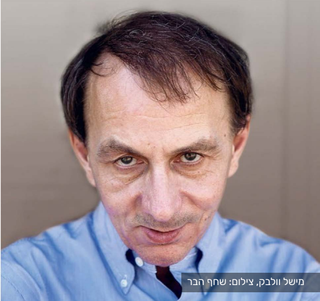
מישל וולבק