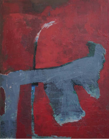
נטע גורן, זה לא כלב, 2012